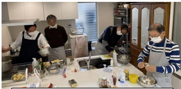
12月9日おやじさんの会議とカレー作りを実施

材料費の値上げ等の諸事情により、少し値上げさせていただきます。ご理解ご了承ください。